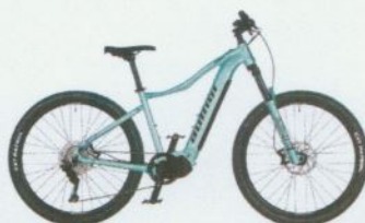
ELEVE ASL 2021