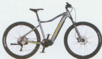
ELEVE 29 2021