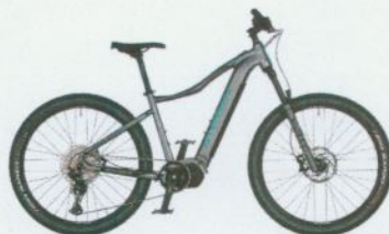
ELEVATION ASL 2021