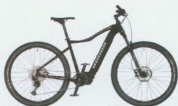
ELEVATION 29 2021